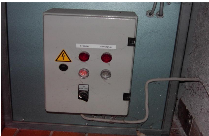
Störungstaste am Ofen für Umskleideräume, WC-Anlagen und Küche