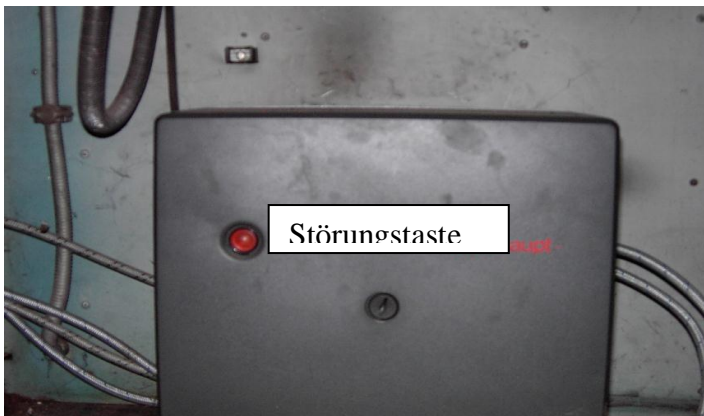
Störungstaste am Ofen für Saal und Foyer