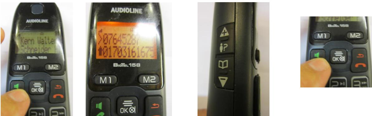
Partner wählen beide Nr. werden angezeigt nach unten wird die Mobilnr. gew. Nr. mit Pfeil wird jetzt gewählt