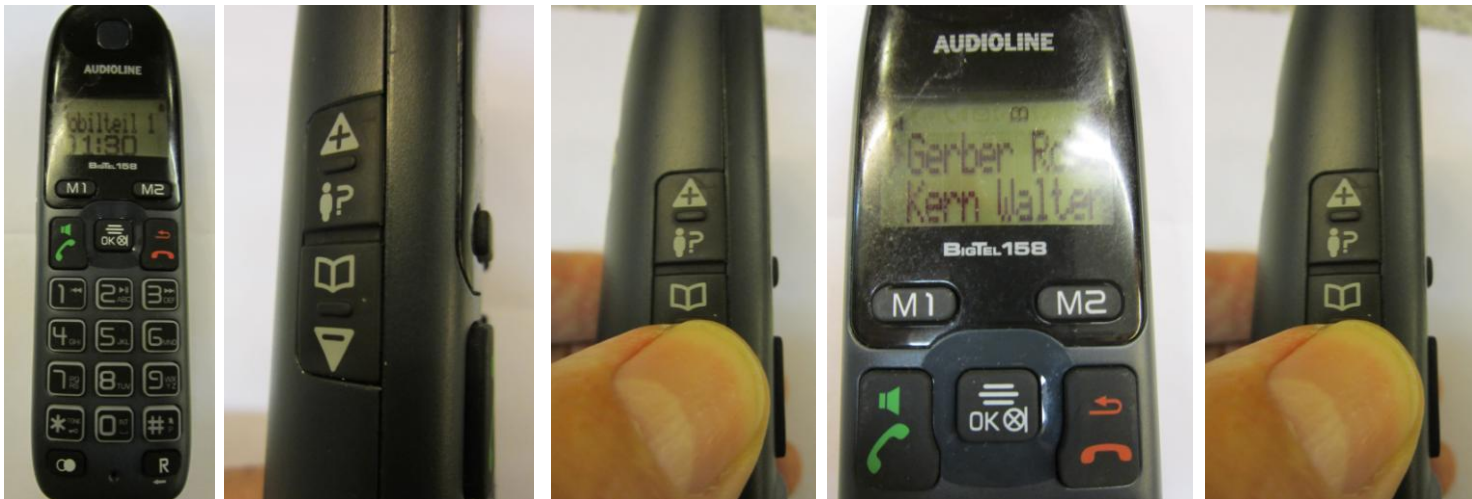
Vorderansicht Einträge Seitenansicht/Telefonbuch Telefonbuch anwählen die ersten 2 Einträge weitere

wir haben den Vertrag mit dem Telefonanbieter geändert und stellen die Nutzung – bis zu einem Höchstbetrag – kostenlos zur Verfügung. Wenn bei der Monatsrechnung für den Mietzeitraum Gebühren (wegen Dauergespräche ins Festnetz und/oder Gespräche ins Ausland und/oder Gespräche ins Mobilnetz) höher als 2,- ermittelt wurden, werden diese auch im Nachhinein noch in Rechnung gestellt. Das Telefon besitzt ein integriertes Telefonbuch mit 1. Vorstand, 2. Vorstand und Getränkehändler, nach der Auswahl des Gesprächspartners kann gewählt werden zwischen seiner Festnetznummer oder Mobilnummer.